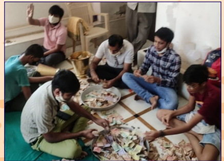
ડીસા ગ્રુપ દ્વારા ભંડાર ગણગ્રીનું કાર્ય