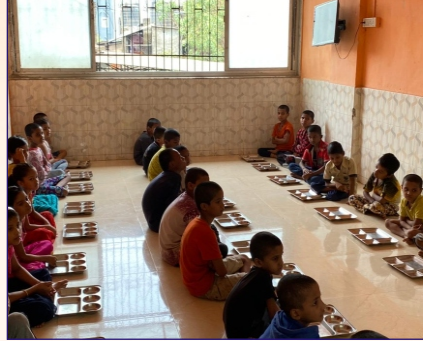
કલ્યાણ ગ્રુપ દ્વારા અનાથ બાળકોને રસ અને પૂરીનું વિતરણ