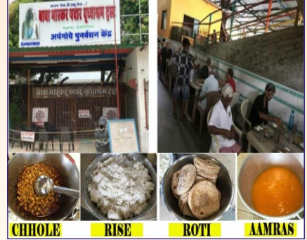
નાલસોપારા ગ્રુપ દ્વારા વૃદ્ધાશ્રમની મુલાકાત તથા છોલે-રોટી-આમરસનું જમણ કરાવ્યું.