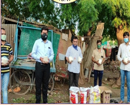
આમોદ ગ્રુપ દ્વારા અનુકંપાદાન