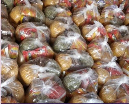
ડોમ્બીવલી ગ્રુપ દ્વારા અનાજની કીટનું વિતરણ