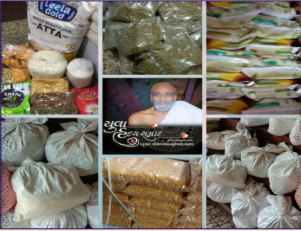
વસઈ ગ્રુપ દ્વારા અનાજની કીટનું વિતરણ