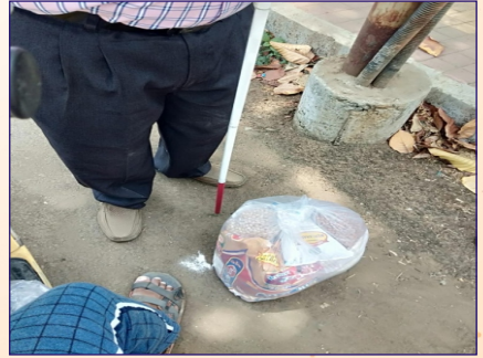
વિરાર ગ્રુપ દ્વારા વિકલાંગના ઘરે જઈને અનાજની કીટનું વિતરણ