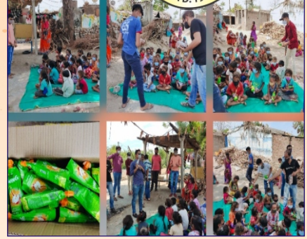
ડભોઈ ગ્રુપ દ્વારા નાના બાળકોને મીઠકા કુટ તથા બિસ્કીટનું વિતરણ