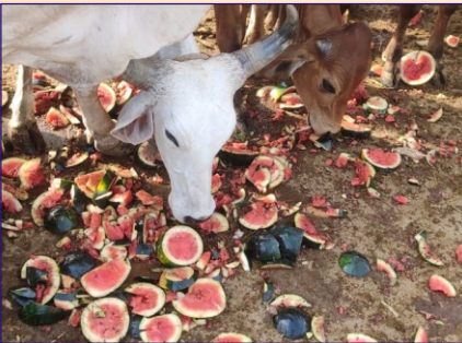
ધાંગધ્રા ગ્રુપ દ્વારા પાંજરાપોળમાં તડબૂચ અને લીલા ઘાસનું વિતરણ