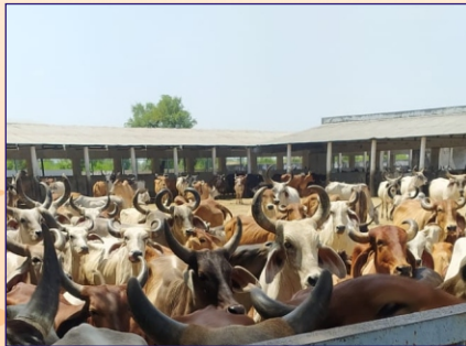
રેવા (અમદાવાદ) ગ્રુપ દ્વારા પાંજરાપોળમાં લીલા ઘાસનું વિતરણ