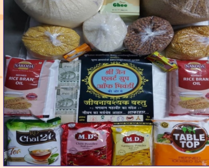
મીવંડી ગ્રુપ દ્વારા ગરીબોમાં કીટ વિતરણ