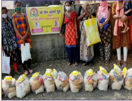
વિરાર ગ્રુપ દ્વારા ગરીબોમાં કીટ વિતરણ